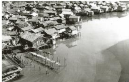
BAIXA DO SAPATEIRO, MARÉ, DÉCADAS DE 1950-1960