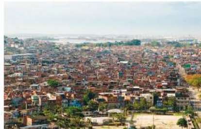
MARÉ, INÍCIO DO SÉCULO XXI